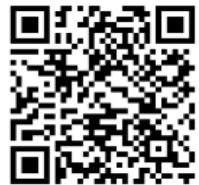
2 e Collecte